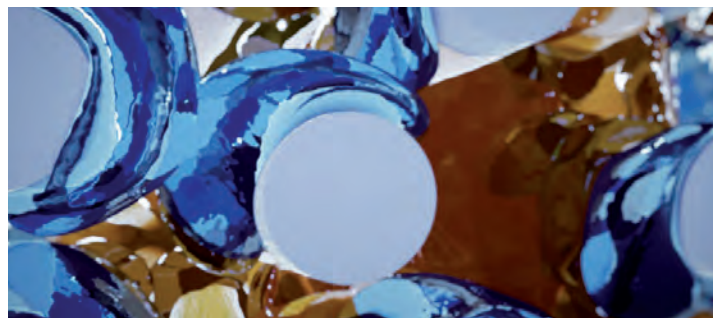
מכט בחתך רוחבי של סיב everStick. סיבי זכוכית ספוגים ב-PMMA ו-bis-GMA.