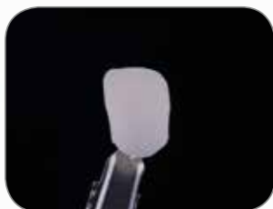
Udført af CDT Simone Maffei, Italien