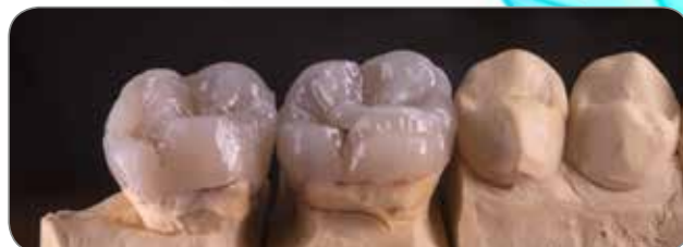
Udført af MDT Nikos Bellas, Grækenland