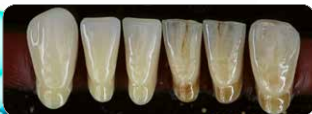
Udført af MDT Jean Francois Deche, Frankrig