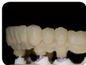
Udført af MDT Christian Rothe, Tyskland