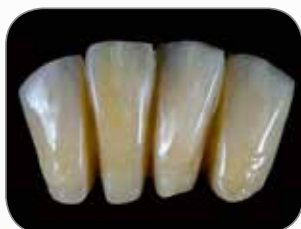
Udført af MDT Philippe Llobell, Frankrig