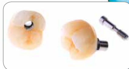
Udført af MDT Simone Maffei, Italien