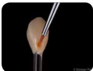
Udført af CDT Christian Thie, Tyskland