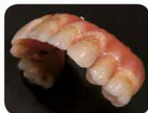
Udført af MDT Roeland De Paepe, Belgien