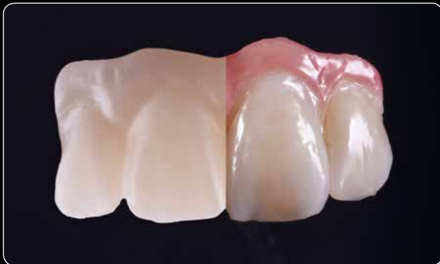
Maksymalna estetyka przy użyciu mikrowarstwy