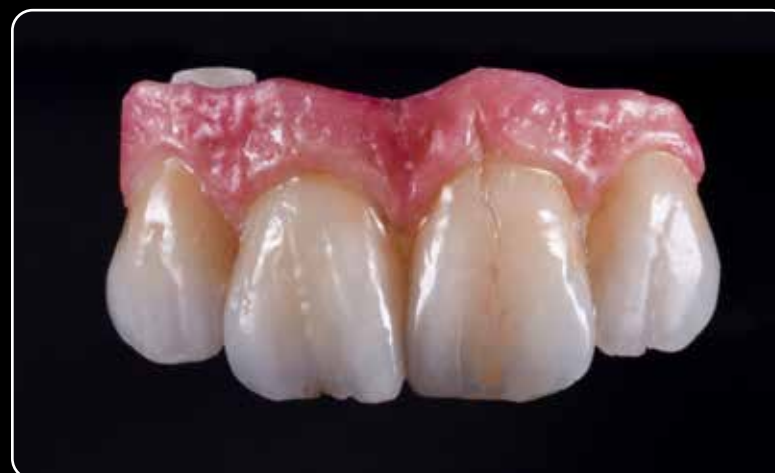
Rode en witte esthetiek