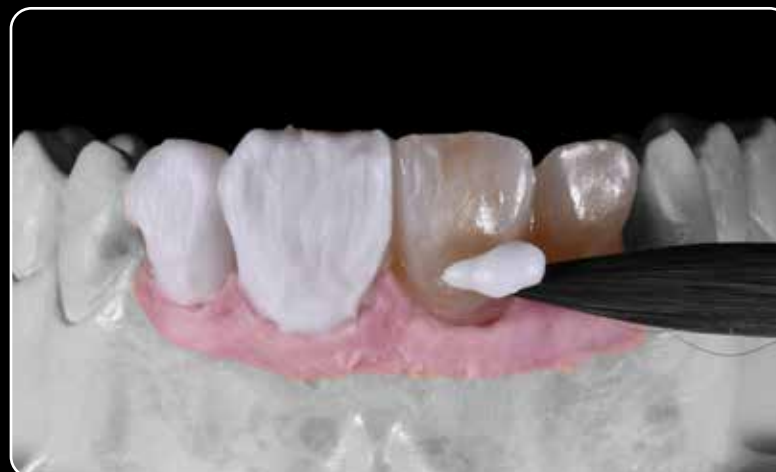
... per la tecnica di micro-stratificazione e per la tecnica di verniciatura