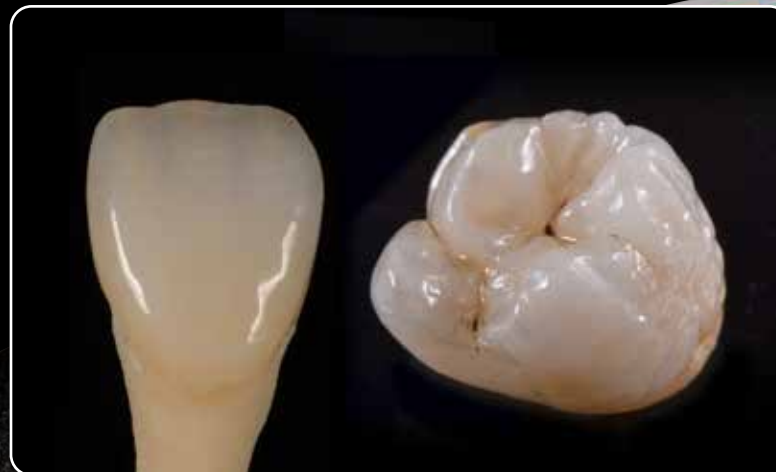
... per tutti i manufatti in ceramica integrale in zirconia e disilicato di litio