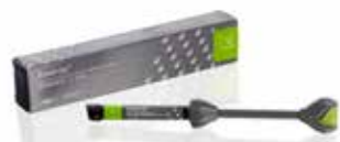
Essentia Universal Универсален композит

everX Flow, Essentia, G-Premio BOND и G-aenial Universal Injectable са търговски наименования на GC. Filtek Bulk Fill Flowable, SDR flow+ и Tetric EvoFlow Bulk Fill не са търговски наименования на GC.