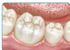
Окончателен резултат след покриване със стандартен композит