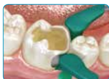
В случай на Клас II кавитет, изградете липсващите стени с конвенционален композит