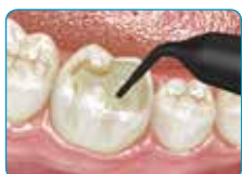
Изпълнете кавитета с everX Flow