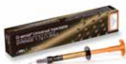
G-aenial Universal Injectable Високо-якостен, инжектируем възстановителен материал