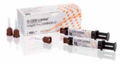
GC G-CEM LinkAce®