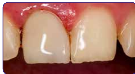
Ergebnis nach Abdeckung mit einer Compositeschicht G-ænial Anterior