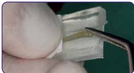
Wurzelstift aus der Packung nehmen und auf die gewünschte Länge zuschneiden