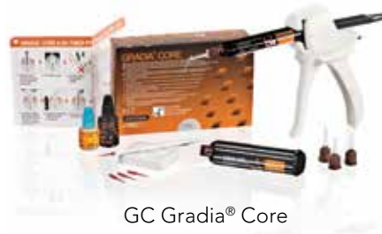
GC Gradia® Core