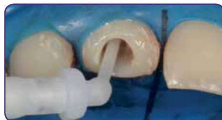
Gradia Core als Befestigungszement auftragen