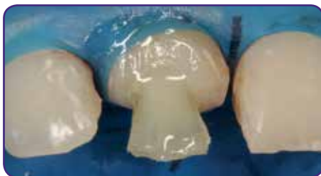
Fertigstellung des Stumpfaufbaus