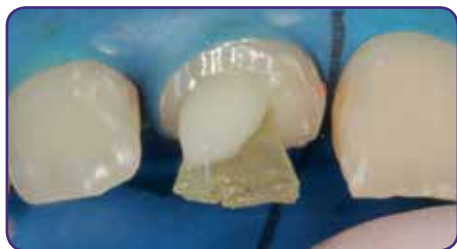
Wurzelstift einsetzen und anhärten