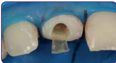
Wurzelstift einpassen und koronal mit einer Pinzette formen