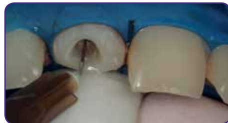
Wurzelstiftraum bis zu 2/3 der Kanallänge vorbereiten und Kanal säubern