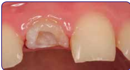
Entfernung der alten Restauration und Vorbereitung