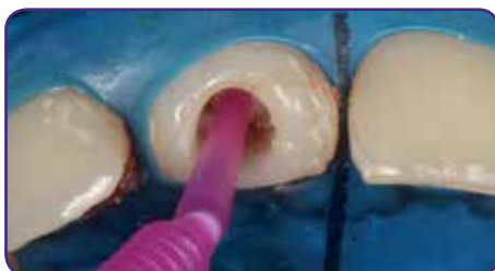
Gradia Core-Bonding in den Kanal geben, trocknen und lighthärten