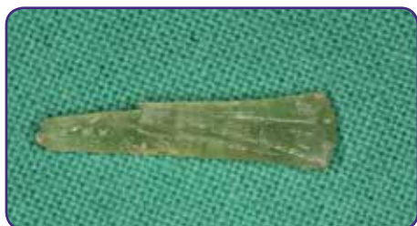
Maßgeschneiderten Wurzelstift entfernen, ohne diesen lichtzuhärten