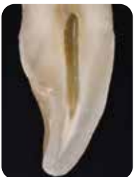
Prof. Marleen Peumans (België)

Traditionele kleursystemen zijn gebaseerd op verschillende tinten, die A, B, C en D worden genoemd. Het is echter bekend dat glazuur en dentine verschillende kenmerken hebben , die elk bijdragen aan de uiteindelijke kleurperceptie van de tand. Door te breken met de traditionele monochrome kleuren en u te concentreren op het reproduceren van de kenmerken van glazuur en dentine , kunt u een veel natuurlijker resultaat bereiken in slechts twee eenvoudige lagen.